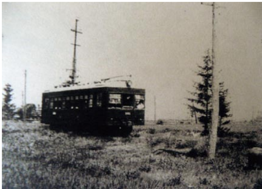
羊の放牧や原木のままの架線柱など北海道らしい沿線風景 昭和28年8月 旭川追分付近

日本の最北にある電車は、札幌市ですが、旭川に電車があった時は旭川が北端と言うことでした。写真を見て当時を懐かしく思い出し、感慨に浸る人、また、電車だけでなく街の変貌に驚き、時の流れを実感する人も多いことでしょう。昭和47年12月31日、市民に惜しまれながら姿を消した電車ですが、既に40年が過ぎ、私達の記憶から離れつつある今日、電車が街の発展に如何に寄与したのか、そして、市民の生活にどのような影響を与えたのかを、歴史上の記録として残し、次の世代に伝えなければならぬと考えます。 旭川電気軌道の歴史を紐解くと、旭川電気軌道株式会社が、大正15年10月に東川線の起工式を行い、まさに突貫工事により、昭和2年に早くも東川線の営業を開始したのです。東旭川線旭山公園までの全線が開通したのは2年後の昭和4年です。旭川市4条通り18丁目の4条駅を始発駅とし、現在の豊岡4条2丁目に追分駅があり、東川線と東旭川線の分岐点となっていました。両線とも通勤、通学の交通手段として利用されたばかりでなく、4条駅で国鉄と繋がっている事から、東川、東旭川の木材、米、石炭、農業生産資材、日用品の搬入にも力を尽くしました。また、旭山公園のお花見や昭和42年開園の動物園見学等多くの行楽客を運んだことも偲ばれます。 最北にある道内初の農村電車が、都市と農村をつなぎ旭川発展の原動力となった事は言うに及ばず、市民生活の向上に多大なる貢献を果たした郷土が誇れる交通機関だったのです。 しかし、昭和40年までは電車利用人員も増え、経営も順調であったのですがバス、トラックの普及で寄る波に勝てず、終に廃止の運命を辿ったのでした。昔の面影を残す電車路線は、全くありませんが、終点東川駅ホームと倉庫。追分駅と竜谷学園前の中間、小股川に架かっている鉄橋。廃線後、現東光6条7丁目に移転された追分駅舎が寂しげに史跡として残っております。また、活躍した電車は、東川博物館と東旭川公民館に展示されております。是非訪れて頂きたいと思っています。