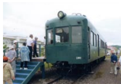
東旭川線を走ったモハ1001