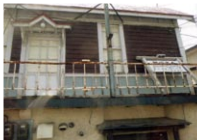
東川線千代田駅(現東光6条7丁目)に移された追分駅と表示板