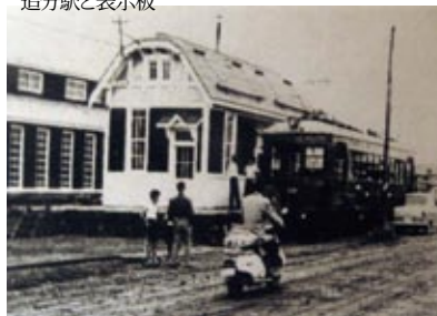
ホームの中央にモダンな駅舎 旭山公園駅 昭和38年8月