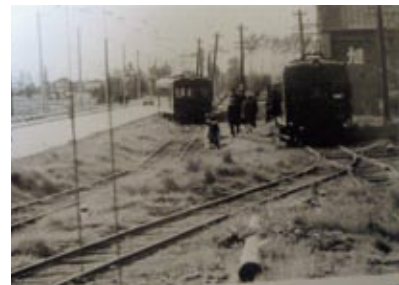
昭和46年 愛宕駅 東旭川線も単線運転であったが、この駅には退避線があり、行き違いの電車が見られる