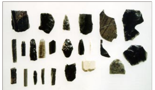
写真II：桜岡2遺跡の旧石器 (小さな短冊形のものが細石刃)