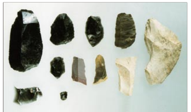
写真III：桜岡3遺跡の旧石器